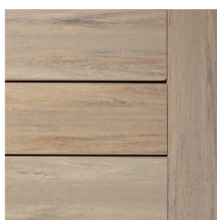
French White Oak™