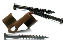
Clips de fixation Concealoc®