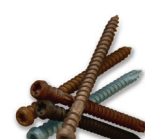
Vis teintées Top Loc®