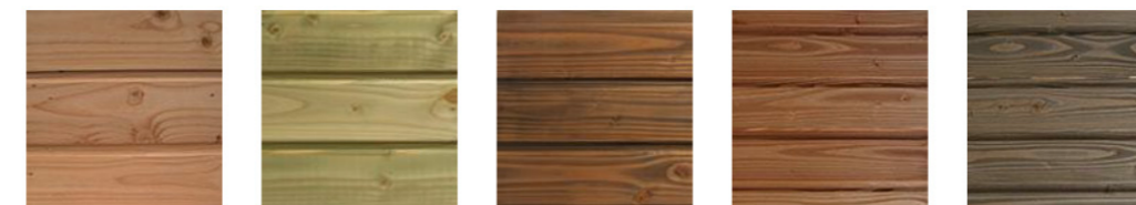
Non préservé Préservé vert Préservé marron Préservé originel Préservé platine